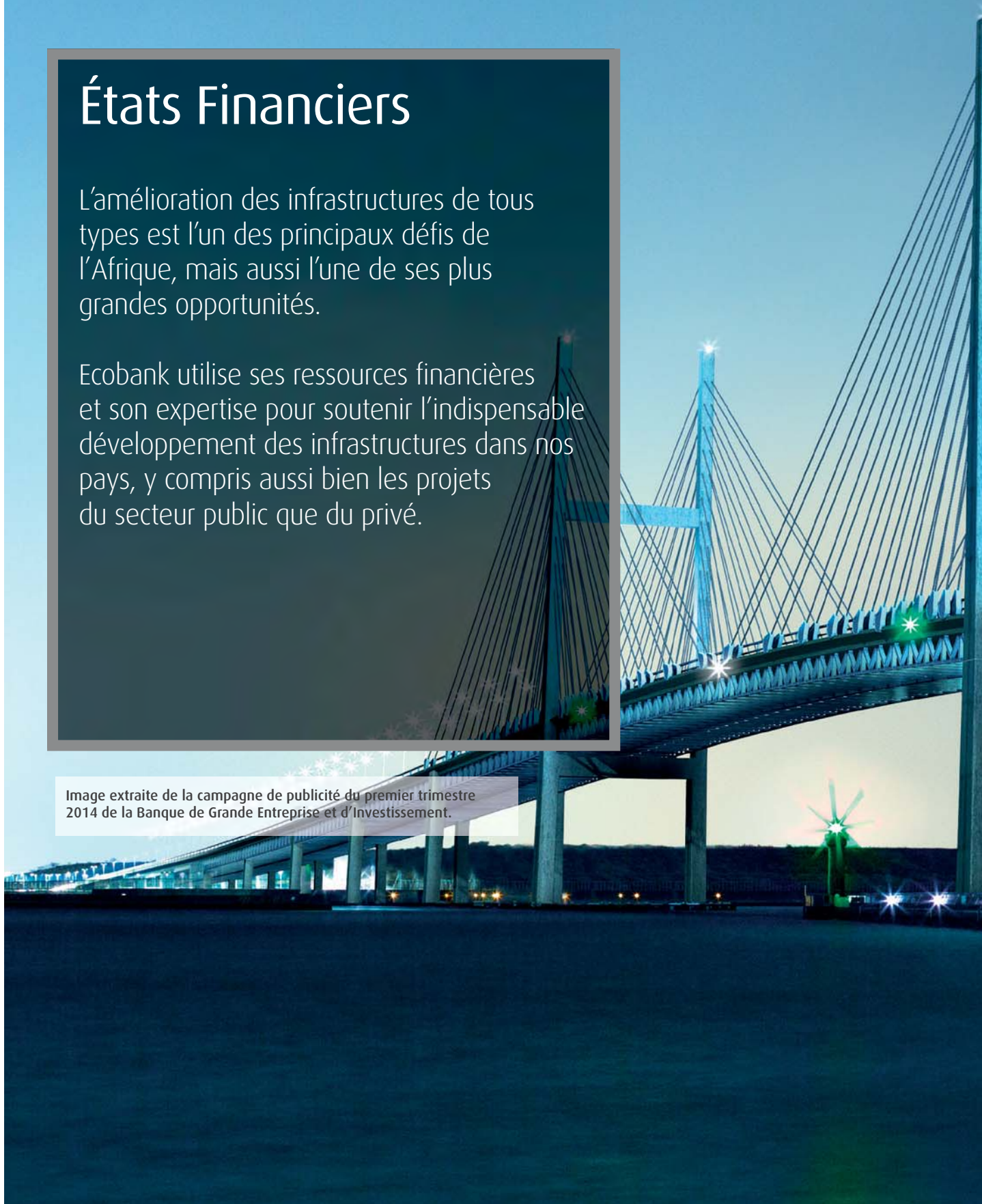
Image extraite de la campagne de publicité du premier trimestre 2014 de la Banque de Grande Entreprise et d'Investissement.

Ecobank utilise ses ressources financières et son expertise pour soutenir l'indispensable développement des infrastructures dans nos pays, y compris aussi bien les projets du secteur public que du privé.