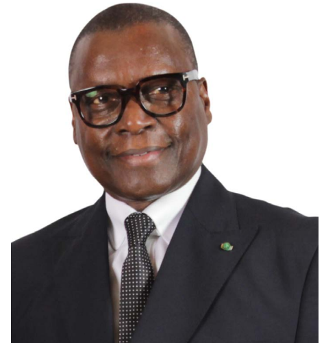
M. Pierre Atépa GOUDIABY, PCA de la BRVM et du DC/BR

Selon le FMI, la croissance de l'économie mondiale est restée languissante, avec une prévision de croissance du PIB en baisse par rapport à celle de l'année précédente à 3,1 % contre 3,4 %, malgré le repli du prix du pétrole, les politiques monétaires accommodantes et la relance des économies avancées. Dans les pays émergents et les pays en développement, qui représentent plus de 70 % de la croissance mondiale, la croissance a ralenti pour la cinquième année consécutive tandis qu'une reprise modeste s'est poursuivie dans les pays avancés.